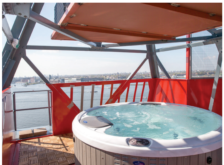
Material gráfico: Villeroy & Boch