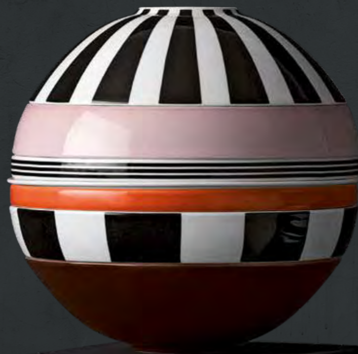
La Boule memphis

Un objet d'art dans des coloris tendances. La Boule memphis se caractérise par son blanc immaculé associé à des rayures noires élégantes, à une nuance rose délicate, à une couleur orange pleine de fantaisie et à une teinte bordeaux expressive. Ainsi, La Boule s'inspire résolument des tendances de couleurs actuelles et, telle une sculpture, elle crée, chez vous, une touche design empreinte d'originalité.