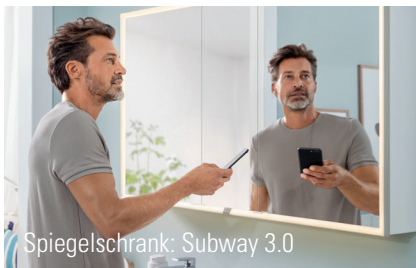
Spiegelschrank: Subway 3.0

Über Profileinstellungen und Sprachsteuerung können zusätzlich viele Individualisierungsmöglichkeiten und Szenarien bei der Gestaltung und Bedienung geschaffen werden. Entscheidet man sich bei der Smart Home Integration für die Produkte eines Herstellers, ist ein optimales Zusammenspiel aller Elemente gewährleistet.