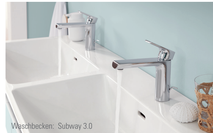
Waschbecken: Subway 3.0

IP 67 – IP 68: Schutz vor Eintauchen im Wasser (relevant für Einbauleuchten innerhalb von Duschen und Badewannen)