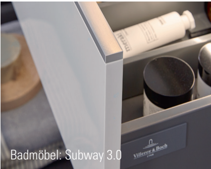
Badmöbel: Subway 3.0

Ambientbeleuchtung setzt Akzente und sorgt für die gewünschte Atmosphäre. Beide Lichtarten sollten früh eingeplant und abgestimmt werden. Mit den nachfolgenden Vorschlägen und Tipps bringen Ihre Kunden zum Strahlen.