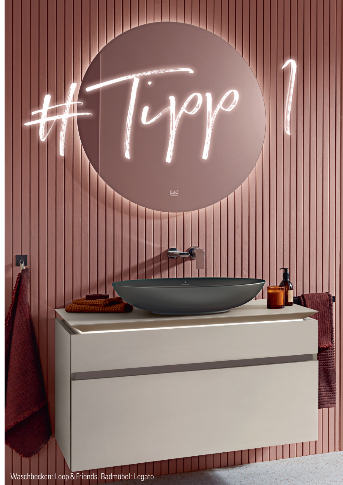
Waschbecken: Loop & Friends. Badmöbel: Legato