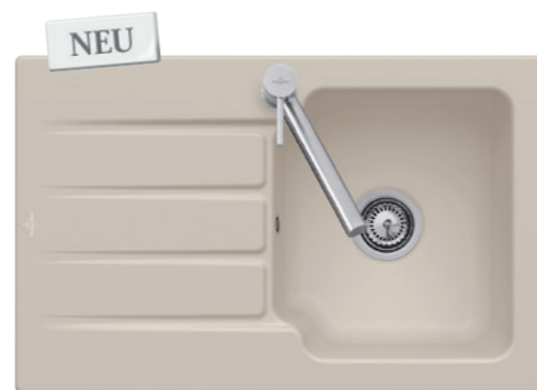
ARCHITECTURA 45 in Almond, reversibel