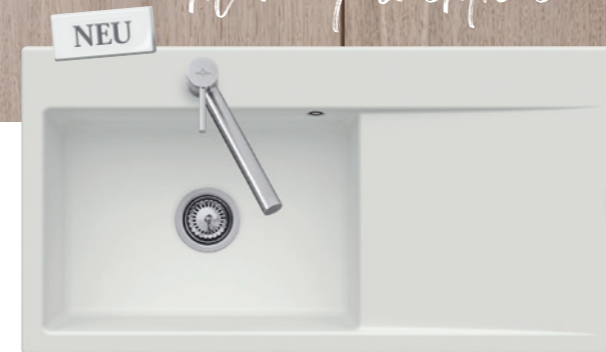
SUBWAY STYLE 60 in Steam, aufliegend oder flächenbündig installierbar