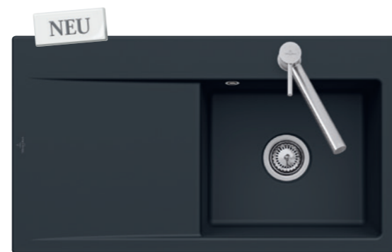
SUBWAY STYLE 50 in Ebony, aufliegend oder flächenbündig installierbar