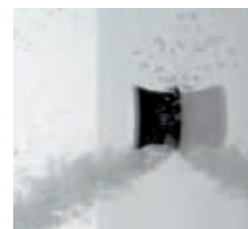
Buses latérales rétractables invisibles