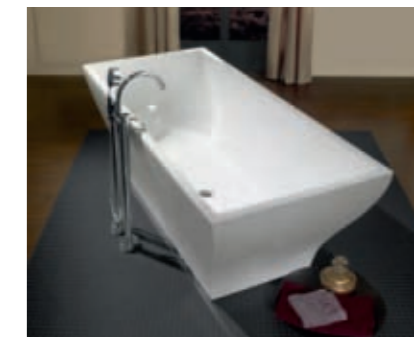
Baignoire La Belle