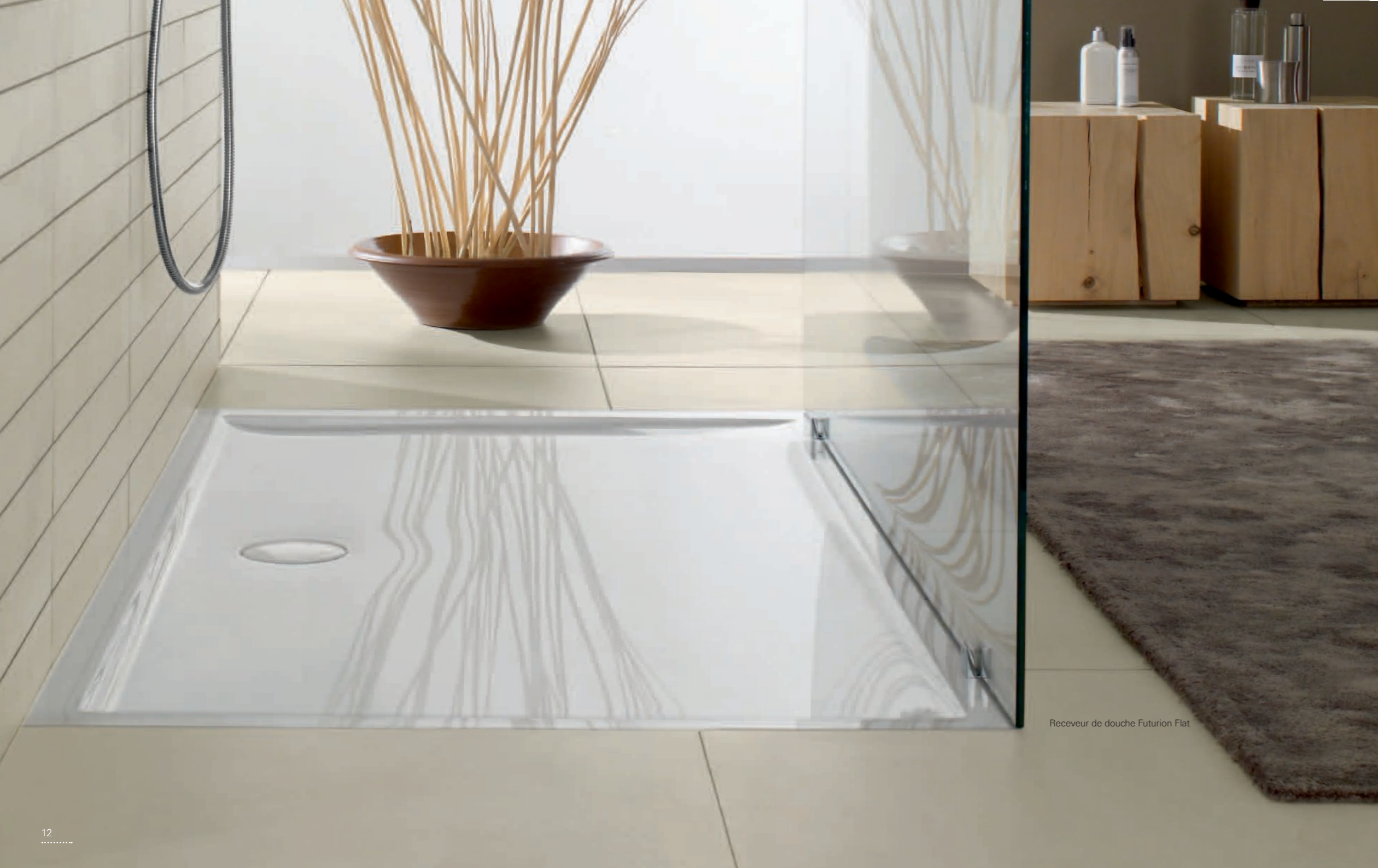
Receveur de douche Futurion Flat