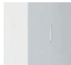
Buses latérales rétractables invisibles