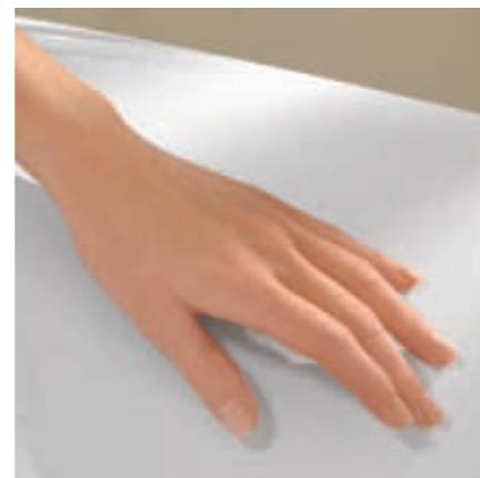
Une finition lisse et exempte de pores

Les produits en Quaryl® ont des propriétés antidérapantes et procurent une agréable sensation de sécurité.