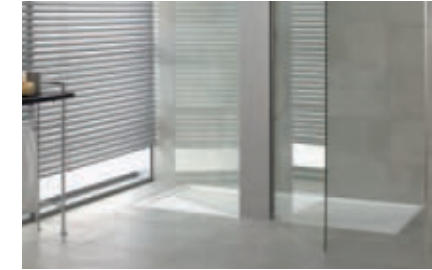
Receveur de douche Squaro Superflat