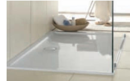
Receveur de douche Futurion Flat