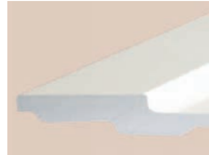
Coupe transversale dans l'épaisseur du matériau

Teinté dans la masse, ce matériau résiste au temps et conserve sa couleur pendant de longues années. Le TÜV SÜD (organisme allemand de contrôle technique des mines) confirme la solidité optimale du matériau ainsi que son extrême résistance aux chocs. C'est pourquoi Villeroy & Boch offre une garantie décennale sur tous ses produits en Quaryl®, conformément à ses conditions de garantie correspondantes.