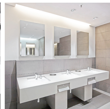
Materiale fotografico: Foto degli interni delle superfici commerciali KaDeWe, Berlino; altre Villeroy & Boch