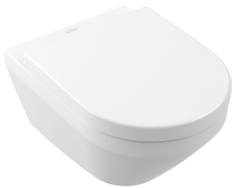
Tiefspül-WC spülrandlos Verdeckte ViFix Befestigung 370 x 530 mm

Vier wandhängende WC-Modelle der Architectura Kollektion sind mit TwistFlush[e 3 ] ausgestattet.