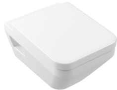
Tiefspül-WC spülrandlos 370 x 530 mm

Alle vier Modelle sind optional mit folgenden Oberflächen für zusätzliche Hygiene erhältlich: