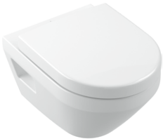
Tiefspül-WC compact spülrandlos 350 x 480 mm