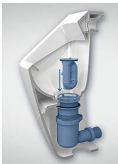
Verwijdering zonder gereedschap

Onderhoud en montage nu nog eenvoudiger!