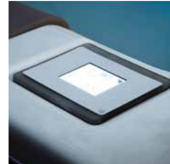
Clavier à écran tactile | Aanraakscherm