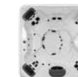
R7 , 4 JetPaks 224 x 224 x 91 cm