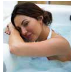
Système de sonorisation de qualité supérieure Elite audiosysteem