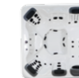
R7L , 4 JetPaks 224 x 224 x 91 cm