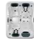
A5L , 3 JetPaks 173 x 213 x 79 cm