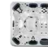
A7L , 5 JetPaks 224 x 224 x 91 cm