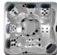
Modèle | Model A8D, 5 JetPaks™ 239 x 239 x 97 cm