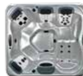
Modèle | Model A6L, 4 JetPaks™ 203 x 224 x 86 cm