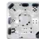
A8D , 5 JetPaks 239 x 239 x 97 cm