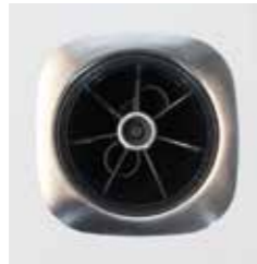
Acier inoxydable brossé geborsteld RVS

Ton sur ton ou bien un habile contraste ? Les spas des lignes Premium et Comfort vous invitent à oser les touches de couleurs. Les possibilités sont énormes : 9 couleurs pour l'intérieur de la coque et les JetPaks™ est jusqu'à 5 couleurs pour l'habillage extérieur. | Ton sur ton of fraai contrasterend? De Spa's van de Premium en Comfort Line kunnen kleurige accenten plaatsen. De mogelijkheden zijn legio: 9 kleuren voor binnenmantel en JetPaks™ en maar liefst 5 kleuren voor de ombouw.