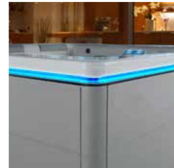
Éclairage extérieur | Buitenverlichting