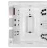
Just Silence, 224 x 213 x 86 cm, 3 JetPaks