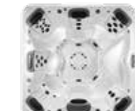
A8 , 6 JetPaks 239 x 239 x 97 cm