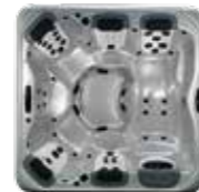
Modèle | Model A7L, 5 JetPaks™ 224 x 224 x 91 cm