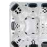
A8L , 6 JetPaks 239 x 239 x 97 cm