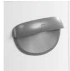
Éclairage extérieur ligne Premium | Buitenverlichting Premium Line