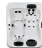
R5L , 2 JetPaks 173 x 213 x 79 cm