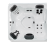
R6L , 3 JetPaks 203 x 224 x 86 cm