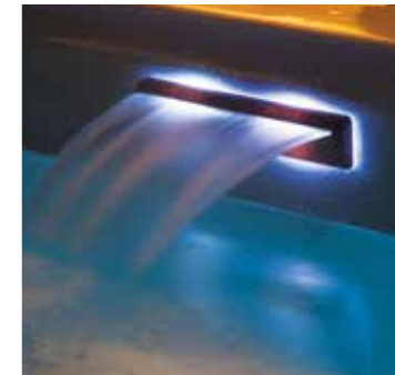
Cascade | Waterval