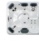
A6L , 4 JetPaks 203 x 224 x 86 cm