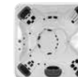
A7 , 5 JetPaks 224 x 224 x 91 cm