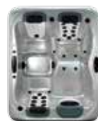
Modèle | Model A5L, 3 JetPaks™ 173 x 213 x 79 cm

Standard : habillage extérieur white, coque couleur Titanium, JetPaks™ snow. Autres modèles disponibles en argenté / blanc. Standaard: ombouw wit, binnenmantel titanium, JetPaks™ snow. Meer modellen leverbaar in Silver/White.